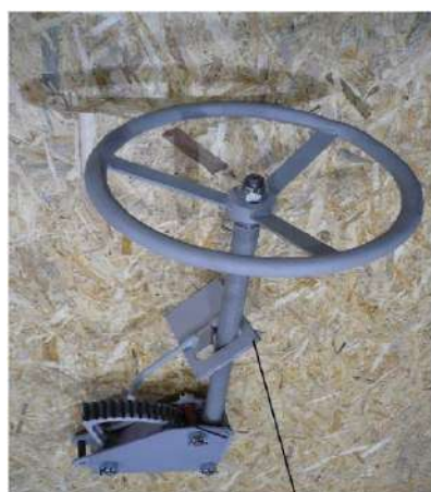
стопор в сборе